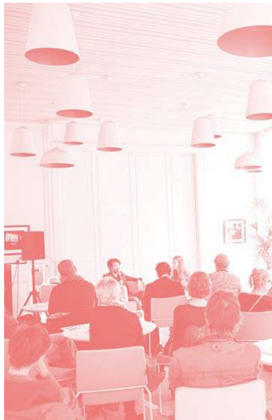
Muntpunt (Literair Salon)

Muntpunt est une bibliothèque, un lieu d'information et de rencontre.